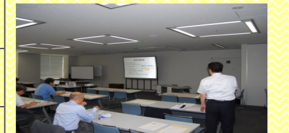
北陸労働金庫による、東日本大震災時の活動報告の様子です。