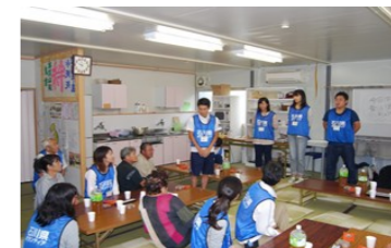
桜畑仮設住宅でのお茶会にて、住民の方との交流を通じて、震災当時の様子や仮設住宅での暮らしぶりについて学んだ。