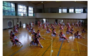
牡鹿中学校にて、力強いソーラン踊りを披露してくれた生徒のみなさん。