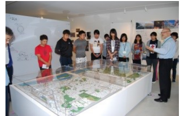
石巻市復興まちづくり情報交流館にて、東日本大震災からの復旧・復興事業の進捗や地域における街づくりの取り組みについて学んだ。