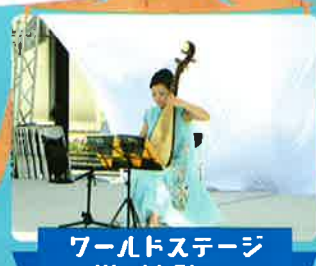
ワールドステージ World Stage

イベント会場内では新型コロナウイルスの感染防止対策を行いますので、皆様のご理解とご協力をお願いいたします。