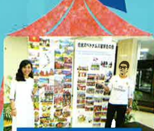
パネル展 Exhibition Corner