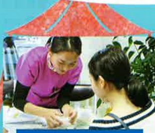
体験コーナー Hands-on Activities