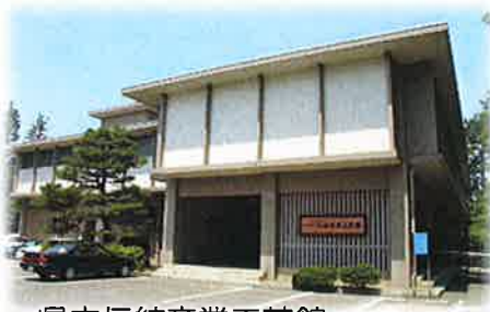
県立伝統産業工芸館