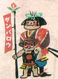
いも版画 川上 盈