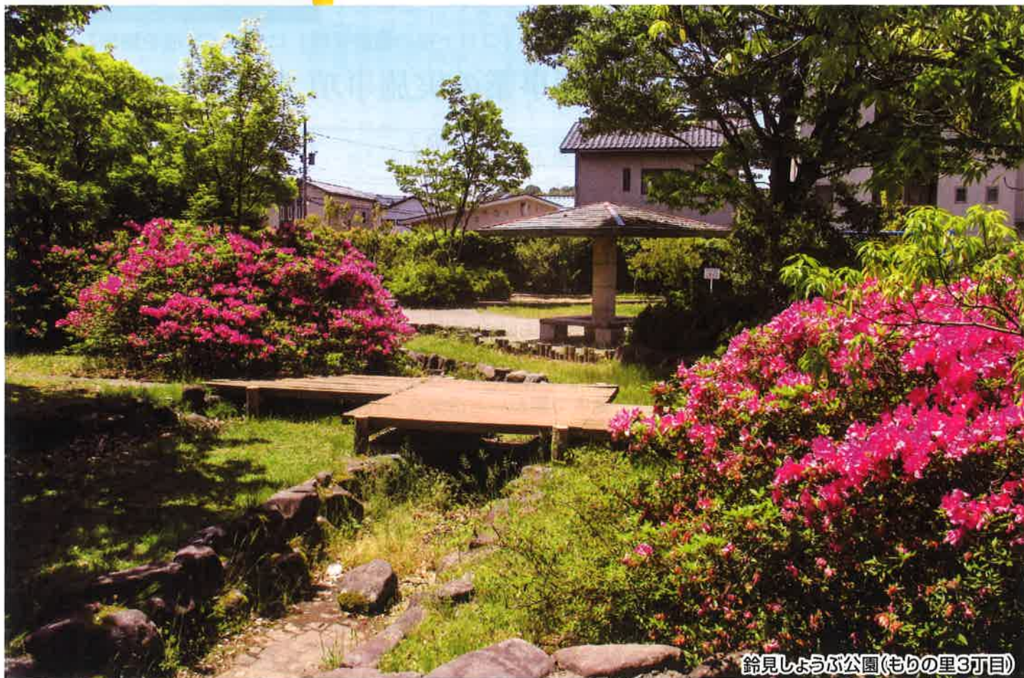
鈴見しょうが公園(もりの里3丁目)