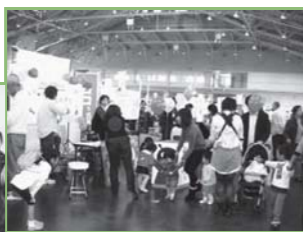
▲子育て支援メッセの様子