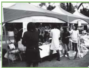
▲金沢エコフェスタの様子