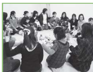
▲玉川こども図書館子育てサロンの様子