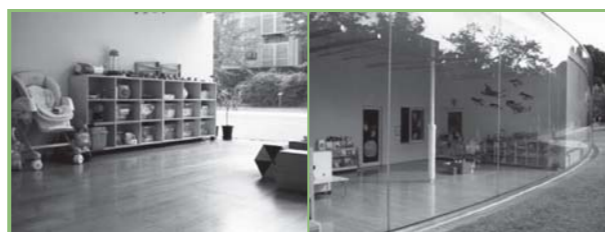
▲保育ルームの様子