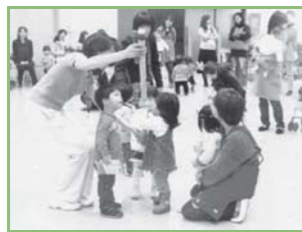
▲戸室キッズの森リユース市の様子