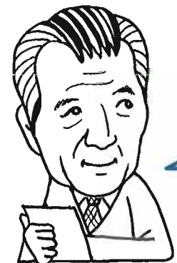
東外男 委員 石川県県民文化局

県内には、社会的な関心と自主性を持ち、独自で活動するグループが、想像を遥かに越えた数で存在することを知って驚いています。NPO活動支援センターでは、知りたい情報を得たり事務所機能を利用できるだけでなく、多くの活動家との出会いもあるでしょう。今後の活動に広がりや元気を提供する拠点にみんな育てていきたいと、期待しています。