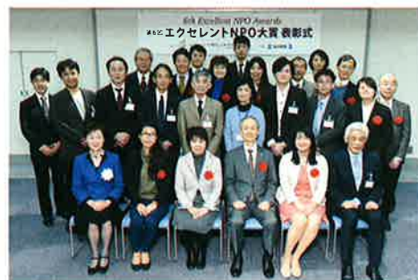
※第6回表彰式風景写真