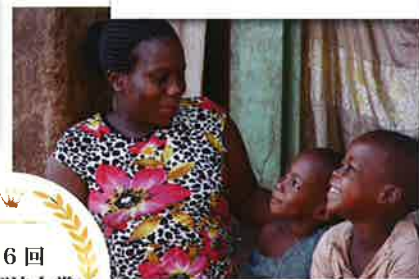
エイズ孤児支援NGO ・ PLAS (東京都台東区)

両親または片親をエイズで亡くした18歳未満の子ども＝エイズ孤児問題の解決に向けて、ケニアとウガンダで活動。エイズ孤児が自らの未来を前向きに切り拓ける社会の実現を目指している。