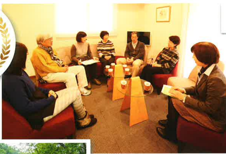
がんサポートコミュニティー (東京都港区)

がん患者とその家族のために臨床心理士やソーシャルワーカー、看護師といった専門家による心理社会的なサポートを提供。世界最大のがん患者支援非営利団体 Cancer Support Communityの日本支部として2001年に設立された。