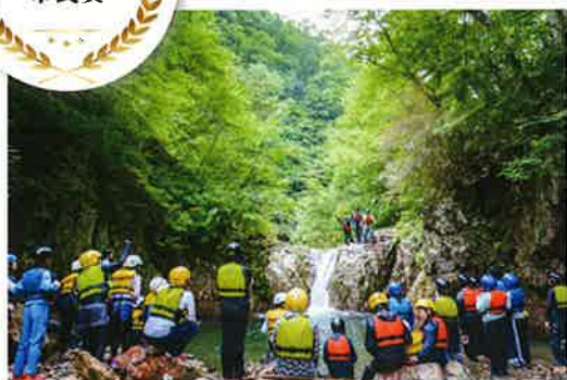
みらいの森 (東京都港区)

児童養護施設で暮らす子どもたちが平等に活躍する機会を得られる社会の実現を目指す。アウトドア活動を通じて生涯の糧となる体験の創出や、幸せで実りある成長のサポートを行う。