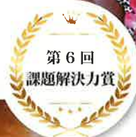
フードバンク山梨 (山梨県南アルプス市)

両親または片親をエイズで亡くした18歳未満の子ども＝エイズ孤児問題の解決に向けて、ケニアとウガンダで活動。エイズ孤児が自らの未来を前向きに切り拓ける社会の実現を目指している。