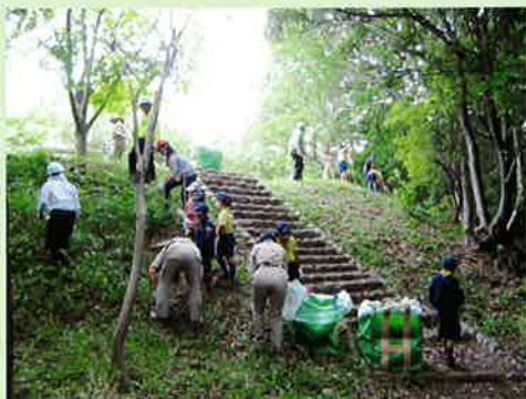
森川海を育てる会(兵庫県神戸市)

地域の資源を大切に、よりよいコミュニティをつくらうとする活動を応援します。広場や道路の緑地帯などの手入れ、花や緑などをいかした名所づくりや地域おこし、地域への誇りや愛着を育む活動などが対象です。