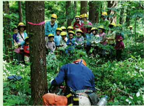
緑とくらしの学校(新潟県上越市)

持続可能な環境づくりのためには、それを支える人を育てていくことが必要です。身近な緑に触れ合いながら体験を通じて学ぶ、環境の中で行う、未来の環境のための教育を応援します。