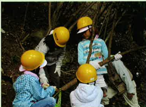
菊炭友の会(兵庫県川西市)

身近な場所に木を植え育てる活動を応援します。また、植えるだけでなく、適正に間伐・伐採し再生するという考え方も大切です。こうした手入れにより持続可能な森づくりに取り組む活動を応援します。