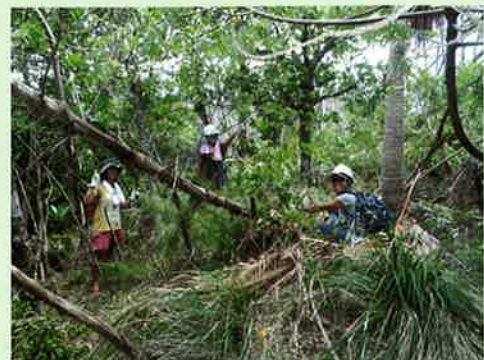
小笠原野生生物研究会(東京都小笠原村)

絶滅が危惧される種を保全したり、地域の生態系に悪影響を及ぼすと懸念される外来植物を駆除するなど、植生の回復を通じて生物多様性の確保に資する活動を応援します。