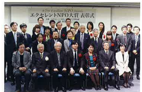
※第5回表彰式風景写真