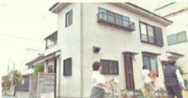
みつばやあんの外観

嬉しかったのは、創業するのに必要な資金額の見積もりです。創業時は資金がいくらあっても足りないという意見もありましたが、借入する以上、無理なく返済できる資金計画づくりが必要です。デイサービスは参入企業が多いため、利用者を十分に確保するまで1年程度は必要と考え、その間を乗り切れる資金額を検討しました。