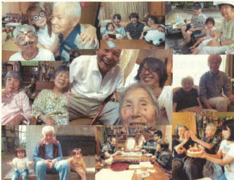
みつばやあんきでの仲間たち

所在地 山梨県甲府市 創業 平成27年12月 分野 まちづくり・高齢者支援 業種 老人福祉・介護事業 従業員数 7人 事業収益 約1千万円(平成28年7月期) URL http://mitsubaya.wixsite.com/mitsubaya/