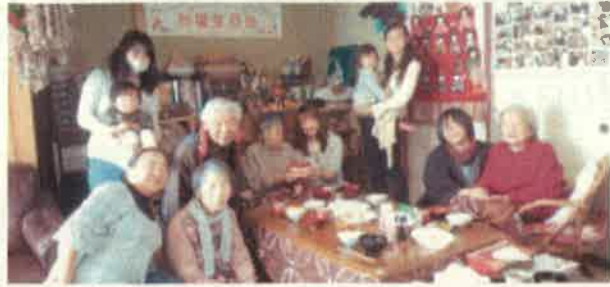
みつばやあんの居間に

幸いにも、担当者から厳しく指摘されることはなく、むしろ創業計画がより良くなるように一緒に考えてくれました。また、当初予定していた物件の賃借が難しくなり、審査の途中で、開設場所を探し直すことになったのですが、審査が長期化する中で