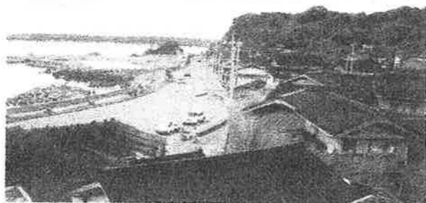
(志賀町富来七海地区)

加能作次郎の作品に「祭見物」なる短編があります。その冒頭部分に「七海」という小さな在所が神輿を新調し、富来祭りに仲間入りしたこと、そして終わり部分に20台余りの神輿の群れで七海の神輿が光り輝いており、大きな在所の神輿に伍している様を「エライ」と褒めている。 そんな七海なる在所で生を受け、長じて祭りに件の神輿も担いだ。社会人となり、富山・東京・横浜・延岡・福岡と各地に転勤した。七海の神輿のように輝くことも褒められることも無かったが、今は父祖の地近くに隠棲中で、まさに邯鄲の夢である。 杖なしでは歩けない身となったが、せめて東京2度目の五輪祭典を見たいと念じている。