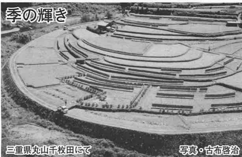
三重県丸山千枚田にて

活動時間は昨年同様に比べて2割減、活動内容は最も多いのは「移送」です。活動内容は最も多いのは「移送」です。活動内容は最も多いのは「移送」です。 「活動時間は昨年同様に比べて2割減、活動内容は最も多いのは「移送」です。