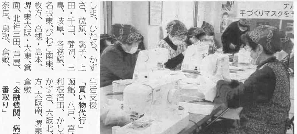
益田拠点では手づくりマスクを市に寄贈