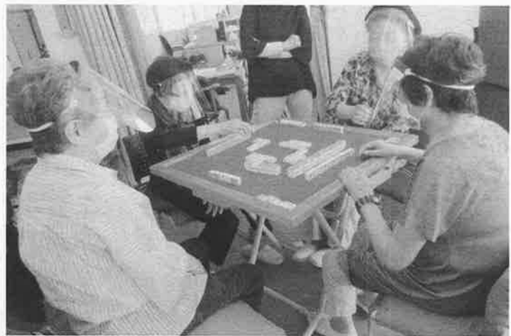
フェイスシールドをつけての麻雀風景