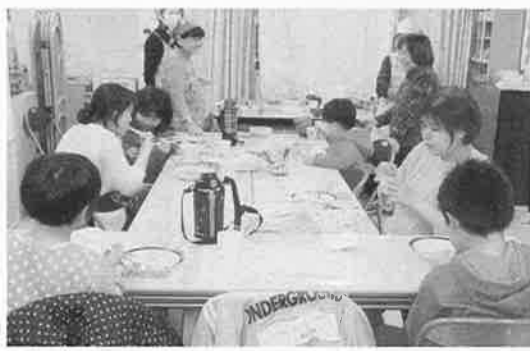
高槻・島本拠点の「ナルク子ども食堂」

新型コロナウイルスの拡大が懸念されつつ、運営委員会での議論を踏まえ、中学校も休校措置が取られ、公民館、コミュニティをはじめ市内のほとんどの施設が休館となりまし