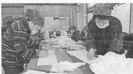
益田拠点のマスク作り

新型コロナウイルスの感染拡大に伴い、各地でマスク不足が発生しているが、マスク作りは、手芸クラブを中心に、3月25日から作業を開始した。会員宅にある布や手ぬぐいなどを持ち寄り、漂白し、縫製し、活動先の特養で働く職員用に100枚ほど配布した。