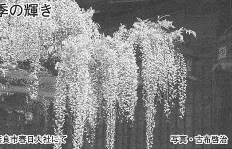
主な会員増加拠点

⑥併せて本部ではビジョン推進のため「組織並びに運営の在り方検討P.T.」組織運営のための人材の育成(後継者の育成も急務である)。「財政健全化の在り方検討P.T.」ナルクが存続するため経営基盤の確立が極めて重要である。「地域と共に在り方検討P.T.」「広報部門強化検討P.T.」各P.T.とも積極的に活動を開始している。