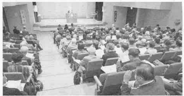
南関東エリアの首都圏フォーラム

⑬併せて本部ではビジョン推進のため「組織並びに運営の在り方検討P.T.」組織運営のための人材の育成(後継者の育成も急務である)。「財政健全化の在り方検討P.T.」ナルクが存続ため経営基盤の確立が極めて重要である。「地域と共に在り方検討P.T.」「広報部門強化検討P.T.」各P.T.とも積極的に活動を開始している。