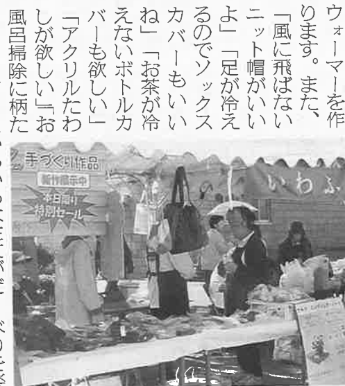
交野市健康福祉フェスティバルに出店時の様子

交野市は、星の里・天の川・織姫神社など美しい地名を持ち、生駒山系の裾野に家々が広がり、空気や水もきれいな住み良い町なのです。