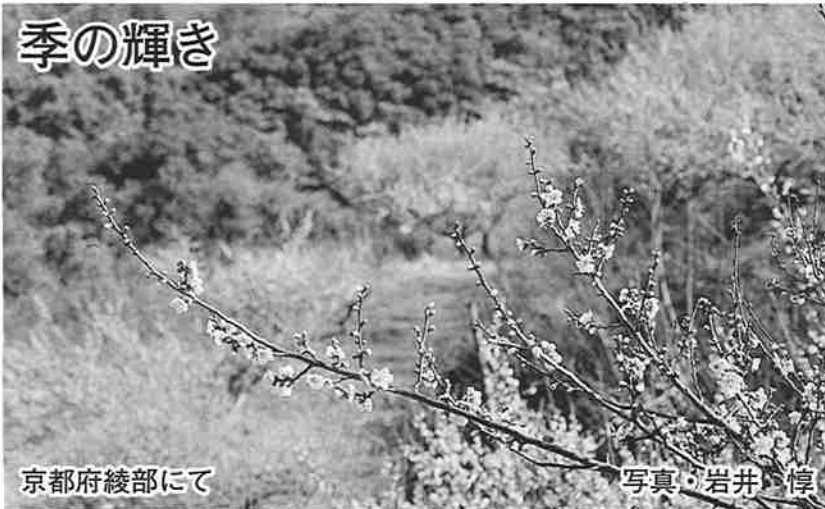
京都府綾部にて