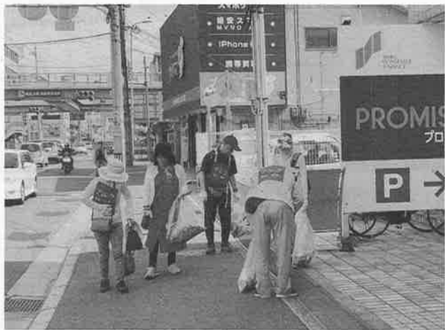
茨木・摂津拠点のクリーンアップ作戦