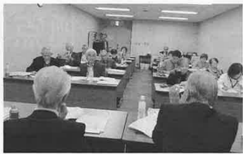
活発な質疑応答があった今回の養成講座