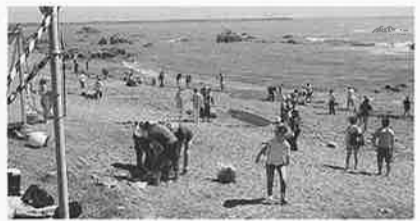
銚子ジオパークでの清掃活動

私たちは、北アルプスと美ヶ原高原の山並みに囲まれた自然豊かな松本平に拠点を置き、日々の活動に励んでおります。私たちが2004年9月に、全国102番目の拠点として30人の仲間とスタートしました。今年も拠点創設15周年の記念の年を迎えますが、現在の会員数は85人です。