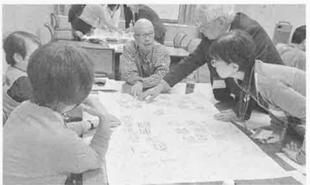
多くの意見が出されたグループ討議

「楽しいナルク・安心のナルク・感動のナルク」の実現に向けてのお話は非常に切実感を感じました。各理事より「定款」「奉仕活動」「事業活動」「会計」「時間預託活動」などに「色々な行事・活動・同好会」にお誘いし、お互いに顔を分かってもらえるように、運営委員自ら、声掛けを進めていきたいと思います。今迄他の拠点の方と話す機会が少なかつたので、今回は大変有意義な研修でした。特に前泊を含む2泊3日の同部屋の2拠点の方と盛り上がり、「スマホの使い方教室」や「SNSの活用による情報交換」など、たくさんの情報をいただきました。今後の活動に活かしていきたいと思っております。ありがとうございます。