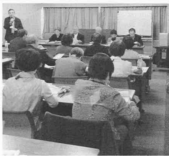
昨年度の「リーダー養成講座」受講風景

研修内容は、会長からの「基調講演」(ナルクの基本理念、リーダーの心構えなど)、各理事による「講義」(拠点運営、時間預託活動、事業活動など)、ナルクの現状における課題あるいは将来のビジョンなどをテーマに、「グループ討議」を行う。 また1日目の夜は全員宿泊とし、参加者同士の交流をより一層深める。 対象は、三役(代表、副代表、事務局長)およびこれに準ずる役員で、拠点において3年以上の活動経験を持ち、次期拠点リーダーとして活躍が期待できる人材とし、各拠点からの推薦に基づき、本部で厳選する。 なお、実施場所は昨年同様「中之島プラザ」(大阪市北区中之島の研修施設)を予定している。