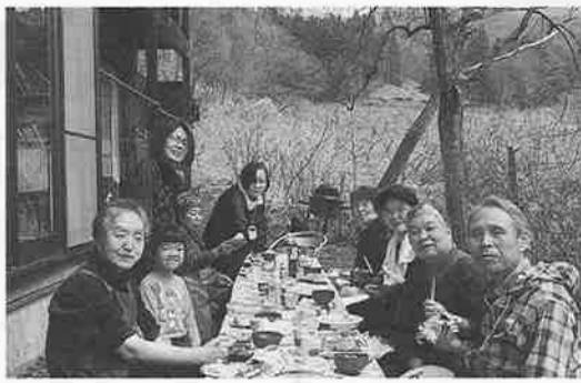
味噌作りで熱う利根沼田の昼食パーティー