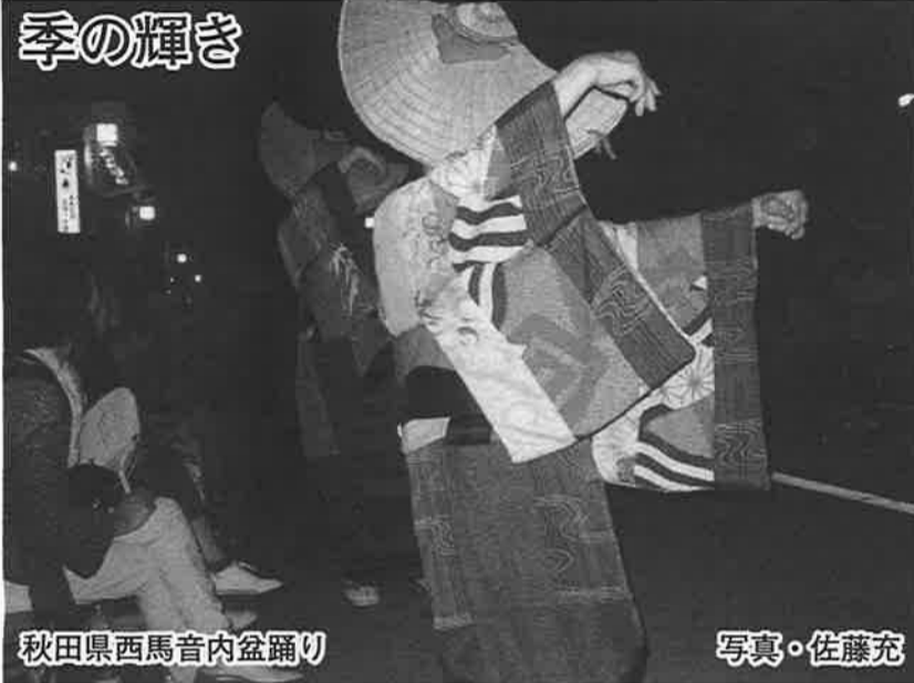
秋田県西馬音内盆踊り

走代表挨拶 まず、多くの来賓、招待客、会員各位のご参加に謝意を申し上げます。ナルク栃木は介護保険開始に先立ち、多くの来賓、招待客、会員各位のご参加に謝意を申し上げます。ナルク栃木は介護保険開始に先立ち、多くの来賓、招待客、会員各位のご参加に謝意を申し上げます。ナルク栃木は介護保険開始に先立ち、多くの来賓、招待客、会員各位のご参加に謝意を申し上げます。