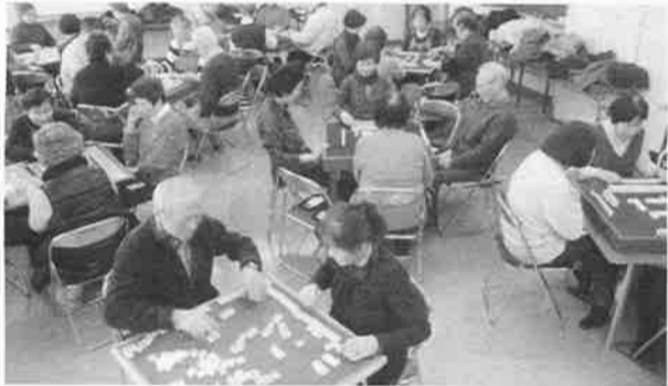
びわこ湖西拠点の健康麻雀風景

同好会活動は奉仕 活動と並んでナルク の重要な活動で、各 拠店の活動資金源に もなっているが、会 員の高齢化と共に活 動内容に変化が起き ているようだ。20 13年5月10日発行 の会報「ナルク」の 記事を参考に、同好 会の活動内容がどの ように変わってきた のか見てみたい。 「全拠点参加者 の多い同好会ベスト 10」では、2002 年(参加総数374 5人)の1位はハイ キング(同663人) キング(同663人) だった。しかし、2 007年(同604 4人)にはハイキン グ(同251人)はこ 湖西拠点でも見ら れる。同拠点は20 07年には「同好会 の参加者の多い拠 点」の第5位(195 人)に入っていた が、2012年には 「同好会」が、多 くの同好会に認定さ れ、多い拠点の活 動資金集めに大いに貢献して いる。