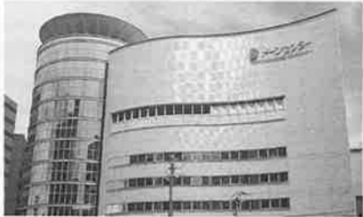
記念イベントが行われ る大阪ドーンセンター の全景