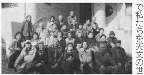
で私たちが天文の世