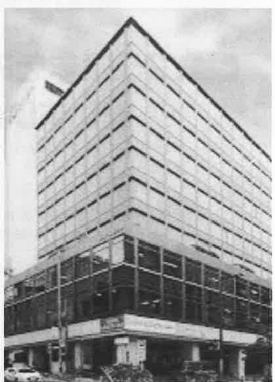
エルおおさか全景 ナルクはここで産声をあげた