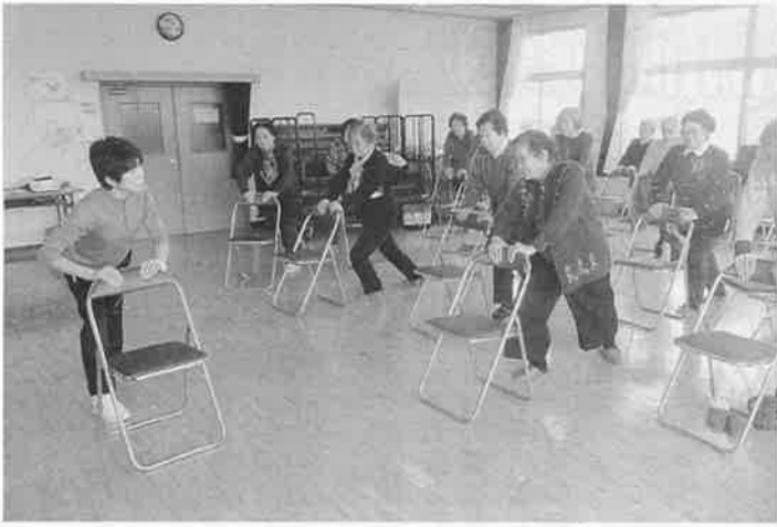
びわこ湖西拠点の地域社会貢献活動「にじのひろば」

ばならない。そのた めにはNPO法人に 対しての助成金制度 に申請も視 野に入れてほしい。 拠点は予算管理を 徹底し経費削減に努 めるとともに、会員 増強、活動強化に務 め、財政基盤の強化 を図っていただき赤 字拠点のゼロ化を図 る。要は「入るをは かり、出づるを制す」 に尽きる。 (5) 総合事業への積極 的な取り組み 「介護予防・日常 生活支援総合事業」 は、昨年度から本格 的に展開されている。 ナルクがこの総合事 業に参加、対応する 方策は、2015年 5月29日の通達で拠 点に周知している。 拠点はこの通達に 示した3つのメニュ ーから、地元の状況