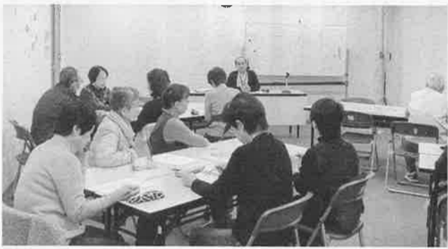
茨木摂津拠点の勉強会風景

平成7年、茨木摂津拠 点は時間預 託制度を掲 げ、ボラン ティア団体 として15人 で発足しま した。当時 の名称はW ACアクテ ィブクラブ 茨木摂津支 部でした。 福祉の知識を持っ た「助け合いのボラ ンティア 団体」と なるため に、勉強 会を重視 してきま した。同 時に活動 内容をマ ニュアル 化し、拠 点の会員 は同じ行 動をとる ことを申 し合わせ ました。