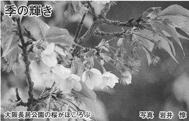
大阪長居公園の桜がほころぶ

今般の介護保険の改正で要支援Ⅱの人たちは全国一律給付の対象外となり、市町村の介護予防・日常生活支援総合事業に移行し、その支援をボランティア団体、NPOなどが担うことになったが、全国的にはその実践が見えてきていない。しかし、今後の展開を見据え、そのためにナルクとして活動会員の増強が急務である。新入会員、今まで活動に参加されていなかった会員に對し「日常生活支援活動テキスト」を活用して研修会を継続的に実施し、支援を必要とする会員及び市民に對する対応することが重要である。 (3)それぞれの拠点を発展させる組織を指し、「エリア17推進会議」での課題解決のための実践行動を 拠点を一層の発展を目指して、地域ブロック(エリア)制を設け、各エリアにエリア担当理事を配置し、エリア内での拠点活動の活性化と連携を強める意図で「エリア17推進」を実践し、担当理事を中心に「エリア17推進会議」を積極的に展開してきた。 エリア会議では主として「会員増強」「魅力ある活動」な