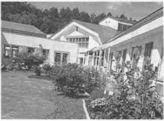
この施設での活動は、中標津拠点設立のころから続いています。5年前から花壇同好会を立ち上げ、同園の前後の花壇整備を実施してきました。そして昨年からの3年計画で中庭の整備が始まりました。

高齢者施設一り、整備。今年11人のメンバーがレンガで作った囲いの中に土を敷き、芝生を植える作業を行いました。来年は春一番にクロッカス可愛い花をつけ、楽しんで花を咲かせるという計画です。中庭は重機が入らず、全て手作業です。それでも作業に当たるメンバーは、喜んで入居