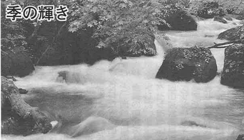
秋の奥入瀬溪流