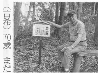
5月に、18年間も乗った車を買い換え川崎から30分ほどで着く千葉にドライブしました。

話し合う会議が実現できたようだ。ナルクは、時間預け活動が売りであるが、より活発な活動と社会貢献をするためには、収益事業の多岐にわたって利用にもウエイトを移す必要がある。収益事業の数が多い拠点は、社会貢献度も高く、同好会・イベント活動も活発な傾向が分かった。エリア内の拠点間で、研修会への相互招待や共催などを増やし、共に助け合うエリア会議(エリア17)が本来目指したものに近づいている。重要だと確認できた。