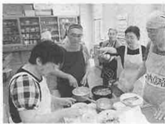
茶道教室を開いて