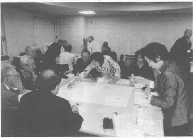
グループ討議の発表作業に当たる受講者の皆さん