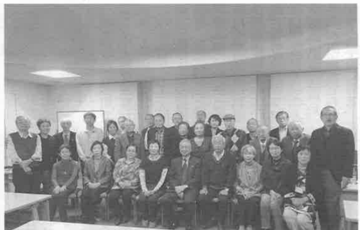
全国から集まった26人の精鋭

「楽しいナルクであること」を再三強調され、会員同士の親睦を促す同好会の意味を再認識でき、気張らず活動し、楽しいナルクを作り、多くの人をお誘いしたいと思えました。介護保険制度改革に伴い、速やかに対応している全国の動きは素晴らしい。日ごろから先を見越して研さんを積み、信頼を得ていた結果と痛感しました。今後、拠点の研修テーマに取り入れます。まず備えをすることが必要と思えました。グループ討議では、皆さん旧知のごとく心を一つにする