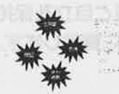
トラウマとなる体験

差別と制度的パワー 戦い場においても、制度的にも つぶやき社会化されている 職場の 組織の 構造の 女性に対する男性が持つ権力(パワー)の アンバランス