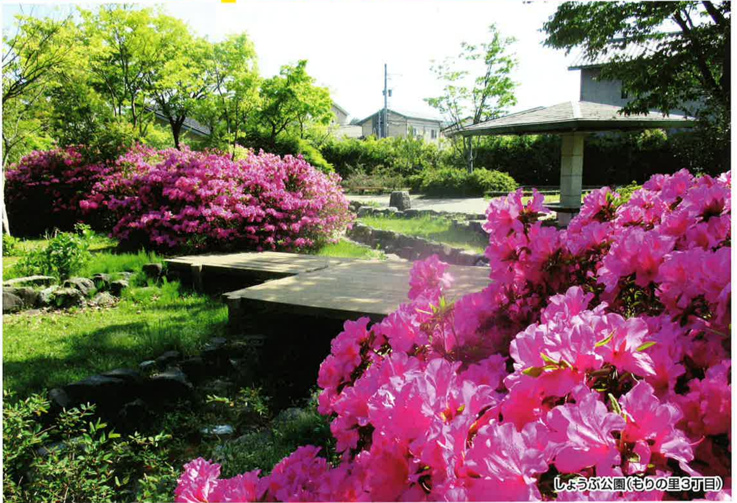
しょうぶ公園(むりの里3丁目)