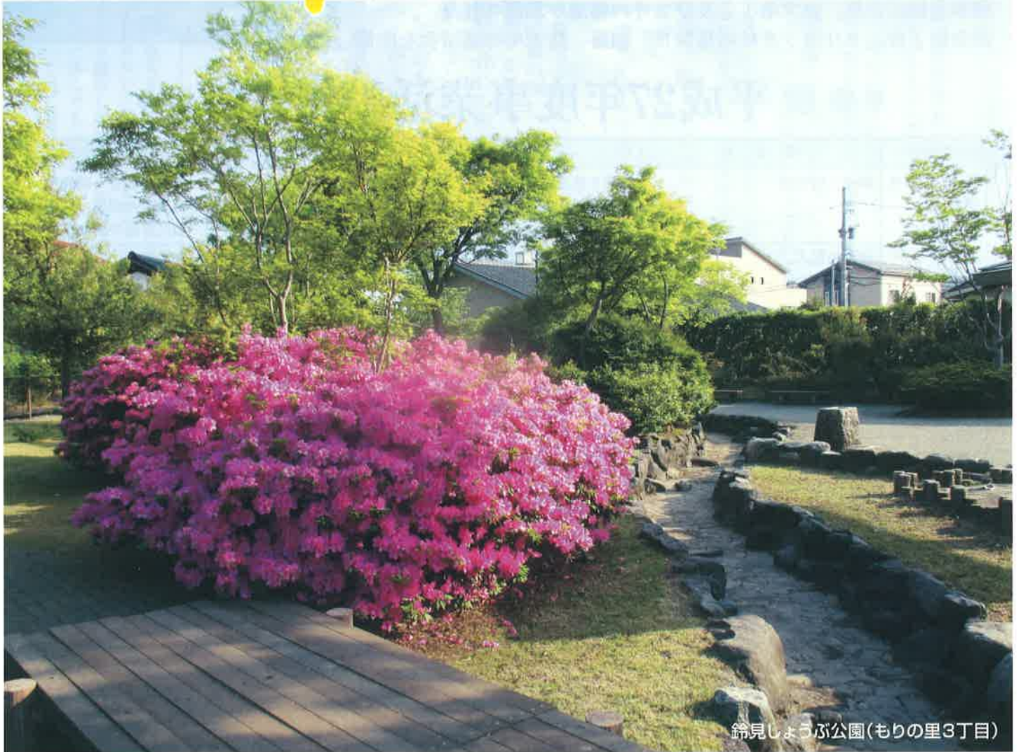
鈴見しょうぶ公園(もりの里3丁目)