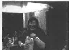
卒業生のみなさんにプレゼントを渡しているところです。