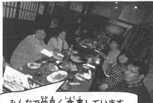
みんなで仲良く食事しています