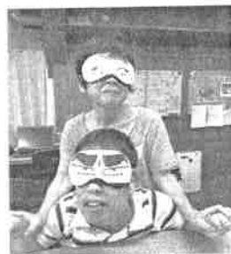
やすみじかんだぜ!

愛知県内の報告書や教育関連の研究発表会でも、例えば「放課中の事故」のように、ほぼ標準語として利用されています。テレビ番組で取り上げられたこともあり、県内でも「放課」が方言であるという認識は広まっていますが、依然言葉の利用は続いています。ただし、市教委などが出す文書には使われていないそうです。いくつかある休み時間の種類に対し、「10分放課」「20分放課」「1時間目の放課(1時間目と2時間目の間の休み時間を指す)」と明確な時間で分類する手法と、「放課」「大放課」「長放課」と相対的な時間で分類する手法があります。また、給食後の放課は「昼放課」「中間放課」と呼ばれています。