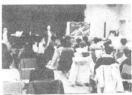
小松会場 X マス例会