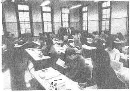
四高記念館 X マス例会