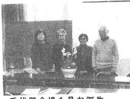
千代野会場 1月お誕生