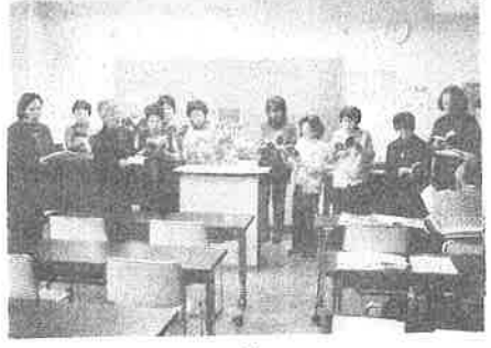
長町中央公民館 X マス例会