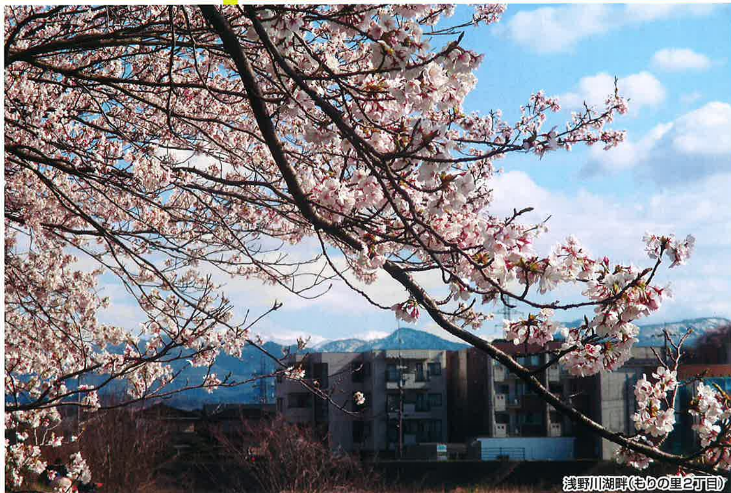
浅野川湖畔(もりの里2丁目)