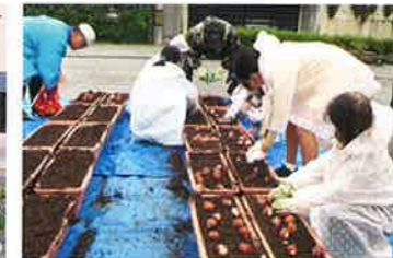
チューリップ球根植え(10/23)