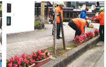
金沢マラソン花壇配置(10/31)