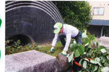
緑地小公園清掃(毎月)