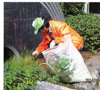
緑地小公園除草(毎月)