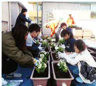
第1回花苗植付(4月13日) 百合の木坂、楡の木坂、若松地内、ペコニヤ600本