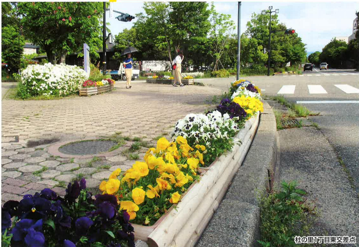
杜の里1丁目東交差点