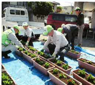
第2回花苗植付(5月11日) 鈴懸坂、ペコニヤ240本