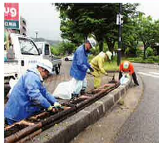
第3回花苗植付(6月8日) 杜の里通り、若松地内、ペコニヤ他390本