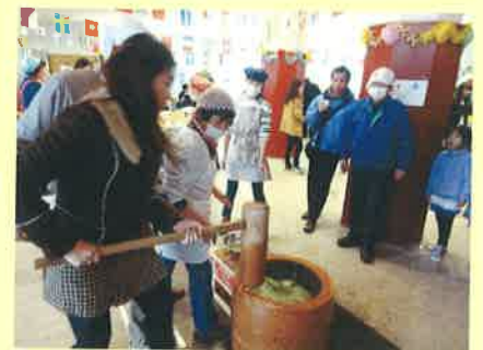
国際交流会館餅つき(28/1/16)