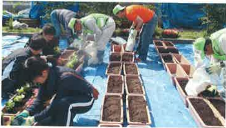
花苗の植付け(第6回 27/11/9)