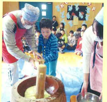
杜の里児童館餅つき(28/2/6)