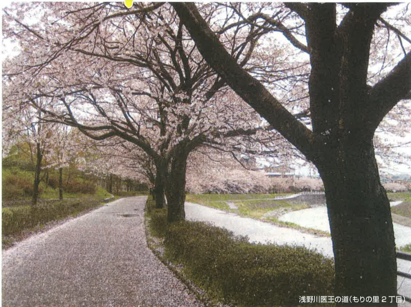
浅野川医王の道(もりの里2丁目)