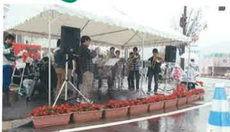
金沢マラソン花壇配置(27/11/15)