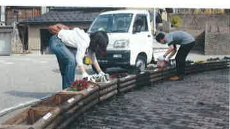
チューリップ、パンジー配置(28/3/6)