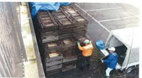
プランター回収(27/12/5・6)